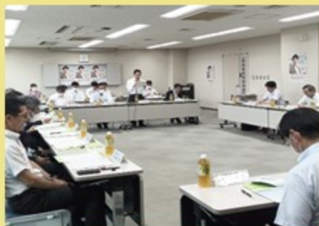
▲ 第9回えひめ就職氷河期世代活躍支援プラットフォーム会議の様子