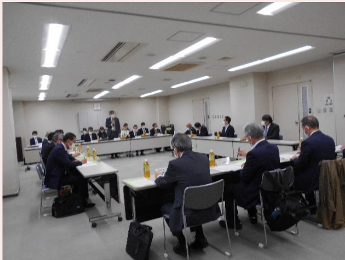
▲ 第8回えひめ就職氷河期世代活躍支援プラットフォーム会議の様子