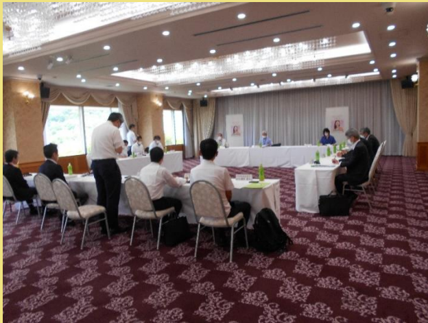
▲ 第7回えひめ就職氷河期世代活躍支援プラットフォーム会議の様子