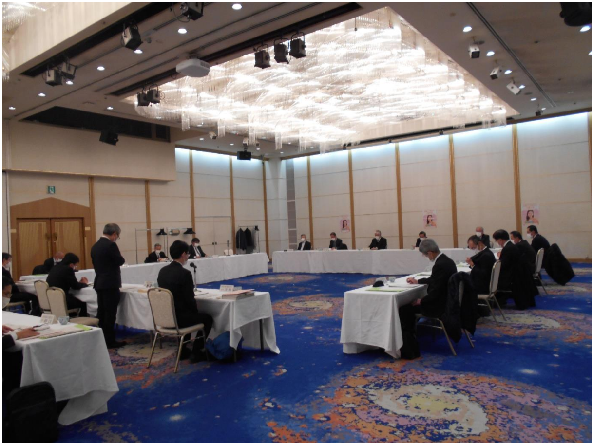
▲ 第6回えひめ就職氷河期世代活躍支援プラットフォーム会議の様子