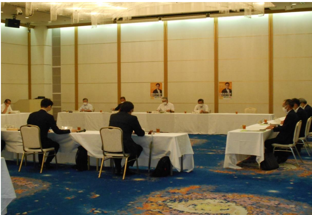
▲ 第3回えひめ就職氷河期世代活躍支援プラットフォーム会議の様子