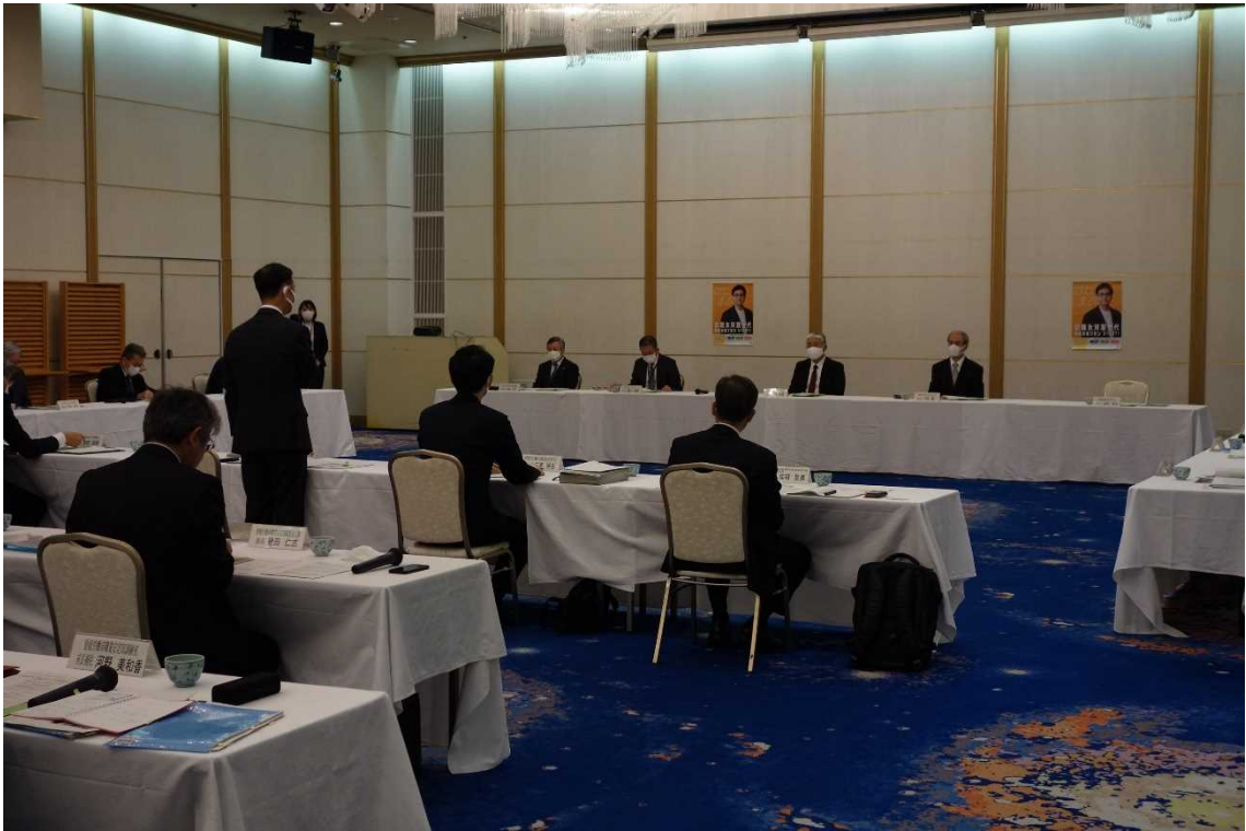
▲ 第2回えひめ就職氷河期世代活躍支援プラットフォーム会議の様子